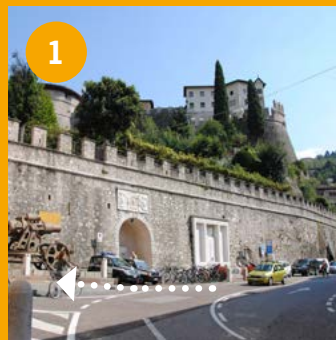
• Piazza Podestà