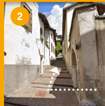
• Via Castelbarco all'angolo con via della Terra